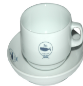
a chávena e o pires