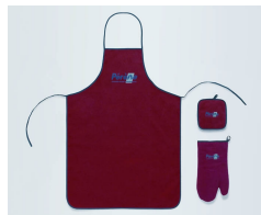
o avental e as luvas